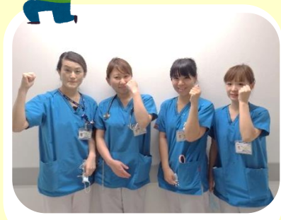
ハイケアユニット病棟