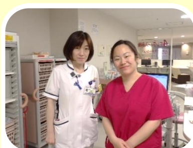
4階レディース病棟